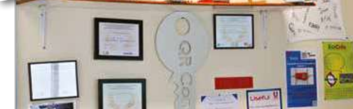
Photo du haut : 2016 – « La Passerole » – Photo ci-dessus : Dans leur salle dédiée, les mini-entrepreneurs qui se sont succédés ont créé un mur rassemblant les prototypes et les nombreux prix qu'ils ont reçu au cours des 10 dernières années.

J'ai déjà géré des équipes, j'ai donc pris un poste à responsabilités ; et j'ai choisi le marketing et la communication parce qu'il y a de l'informatique. En ce moment, on fait des vidéos pour le concours et on vient de terminer notre site.