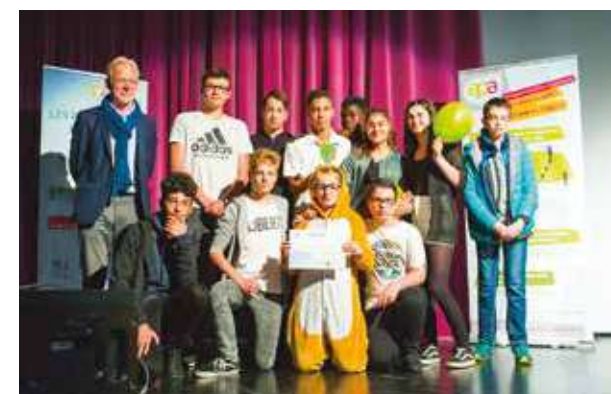
2018 – 1 er prix vidéo « Mille et un cercle »