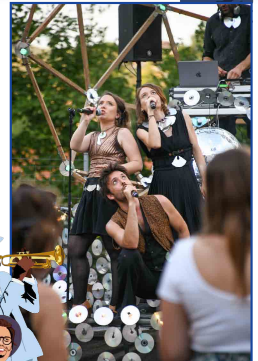
"Le Bal à Facettes", La Compagnie des Gentils

En cas de météo défavorable, la soirée aura lieu à la Maison des Moais