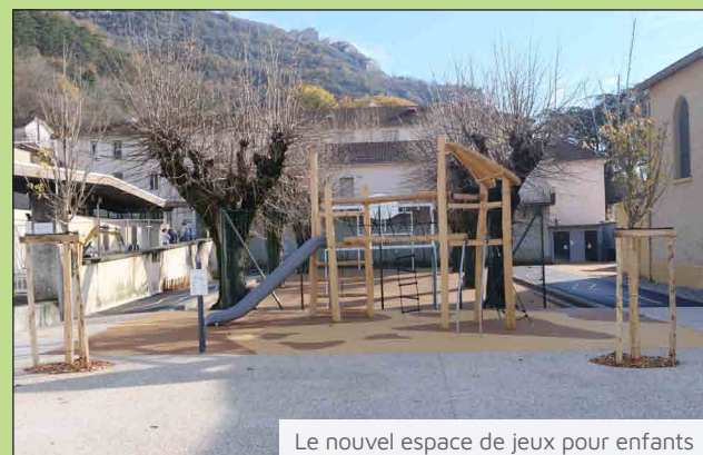
Le nouvel espace de jeux pour enfants