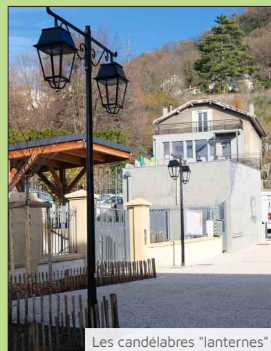
Les candélabres "lanternes"