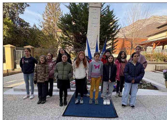
Les enfants de CM2 participant au Passeport citoyen ont déposé 41 roses pour autant de Saint-Martiniers morts pour la France.