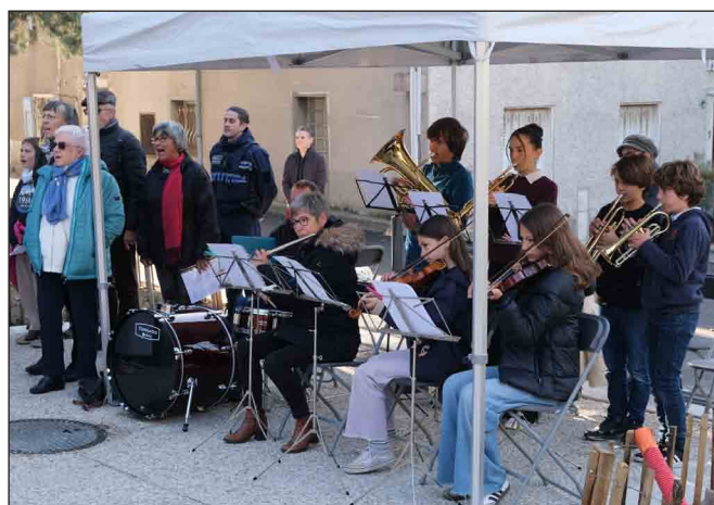
La chorale et les Gruppetti du FAL ont chanté et joué La Marseillaise.