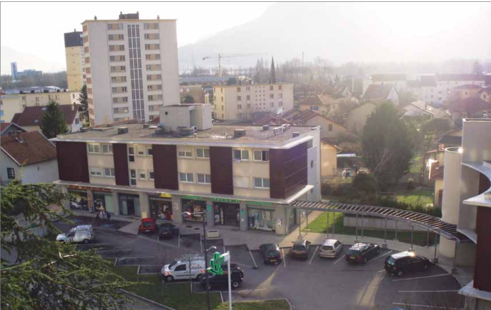
Les commerces de proximité de la Basse Buisserate.

En 2014, la ligne E de tramway desservira 3 stations à Saint-Martin-le-Vinoux : s'achèvera alors le projet de ville et la rénovation urbaine des quartiers de la plaine. Courant 2011, déjà, les travaux commencent. Voici le deuxième des 3 reportages du Bref sur les secteurs de la commune concernés par l'arrivée du tram sur la commune. Après Pique Pierre et avant la Buisserate, voici la Basse Buisserate.