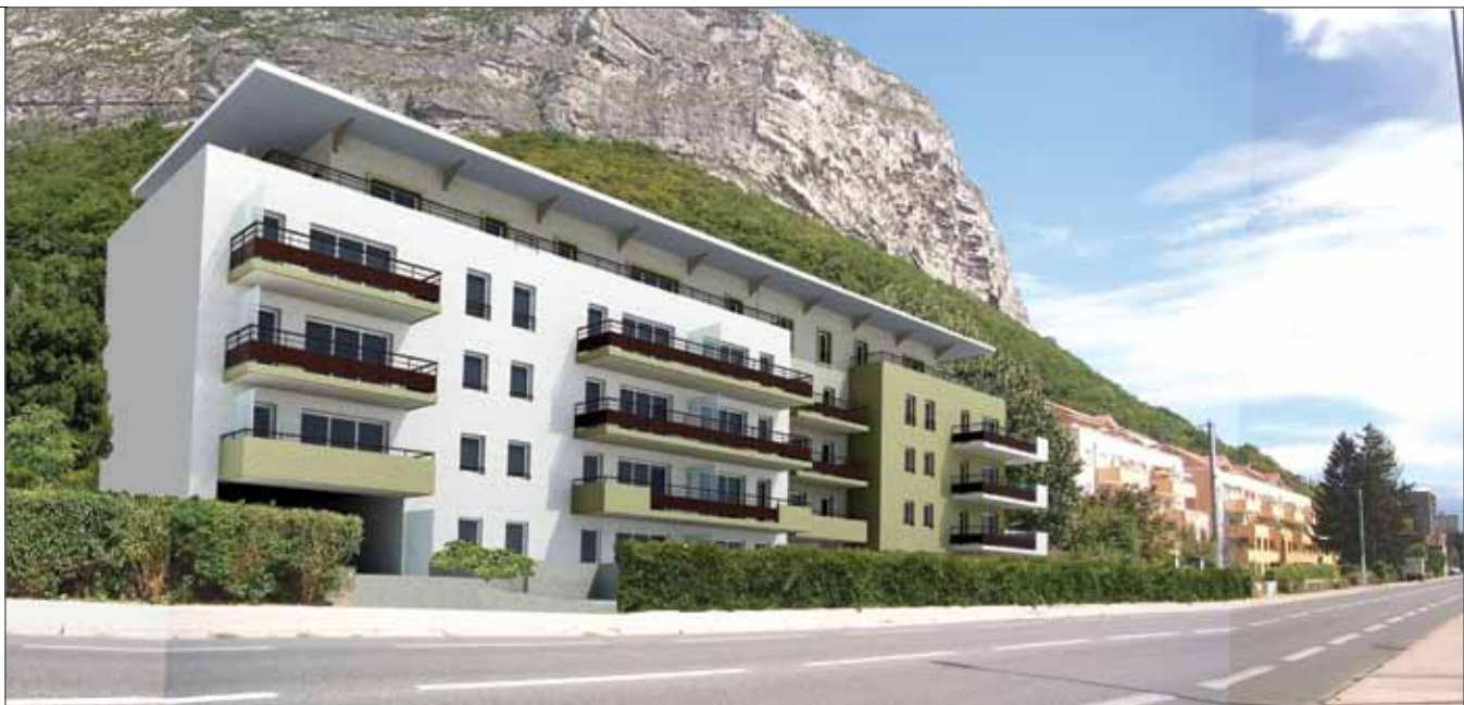
Les Terrasses du Soleil, future construction sur l'avenue Général Leclerc