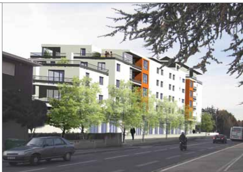
En rez de chaussée du nouvel immeuble, Les Terrasses de Chartreuse, il est prévu l'implantation d'un commerce alimentaire de 980 m 2

L'arrêt de tramway sera situé au niveau du carrefour des rues du 26 mai, du Petit Lac, de part et d'autre de l'avenue Général Leclerc. La Ville va donc réhabiliter complètement la rue du Petit Lac et la portion de la rue de la Maladière jusqu'au collège Chartreuse, avec un nouveau circuit piétonnier des collégiens dès la mise en service du tramway, en 2014. L'aménagement sera travaillé par un groupe de projet, composé des habitants et usagers du collège et des équipements publics.