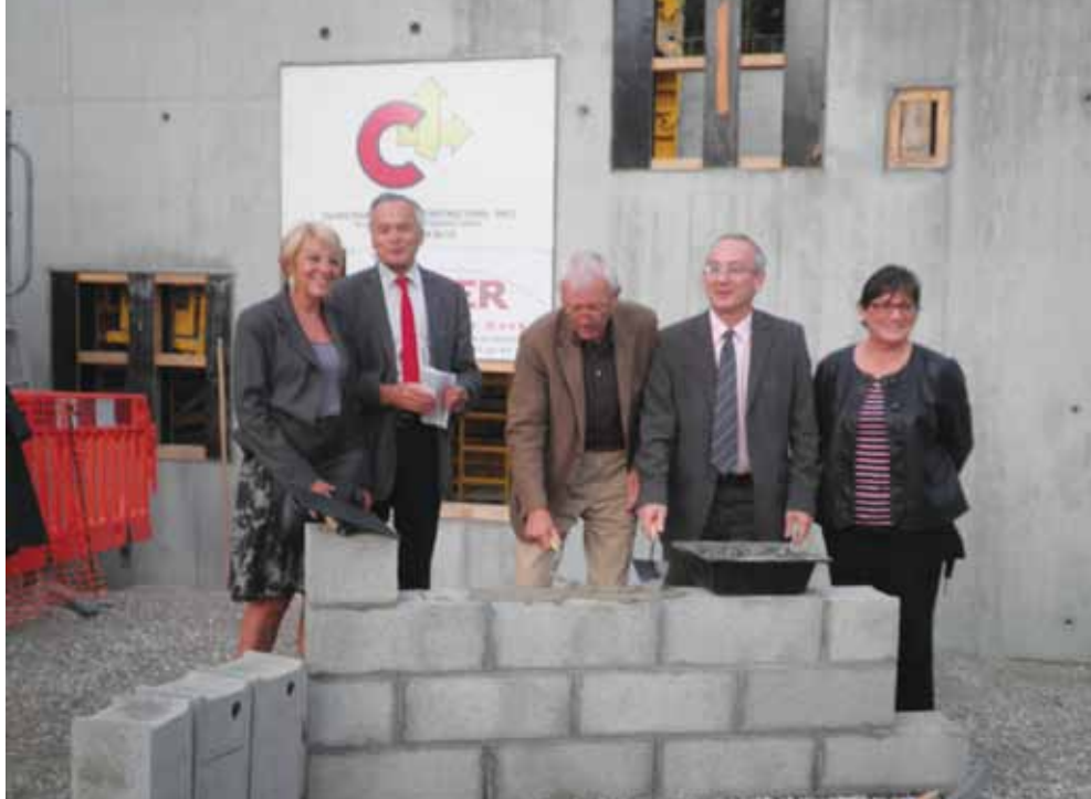
Pose de la 1 ère pierre de l'EHPAD, le 9 septembre 2010