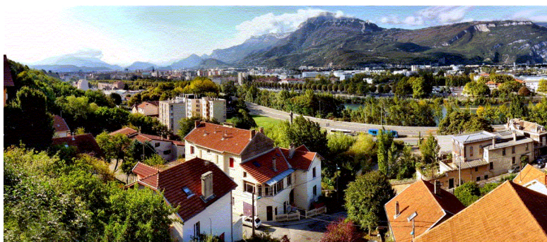
"Il survole presque exactement les anciennes fortifications, donnant une épaisseur à l'espace de la limite entre Grenoble et Saint-Martin, jouant le jeu de cette frontière symbolique aujourd'hui peu sensible" (Etude d'impact, vol2, page 361)