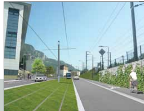
Limiter l'utilisation de la voiture particulière contribue à réduire les émissions de CO2.

Economie d'eau, d'énergie, réduction des pollutions des sols et de l'air... Le plan climat territorial concerne bien des domaines où des actions locales peuvent voir le jour. A l'échelle communale, tous les efforts pour lutter contre le dérèglement climatique comptent et payent surtout s'ils sont faits en même temps.