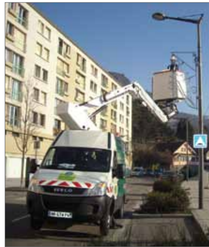
Ci-contre (à gauche) : Le nouveau bâtiment des ateliers municipaux, construit en 2006, plus fonctionnel et plus économe.