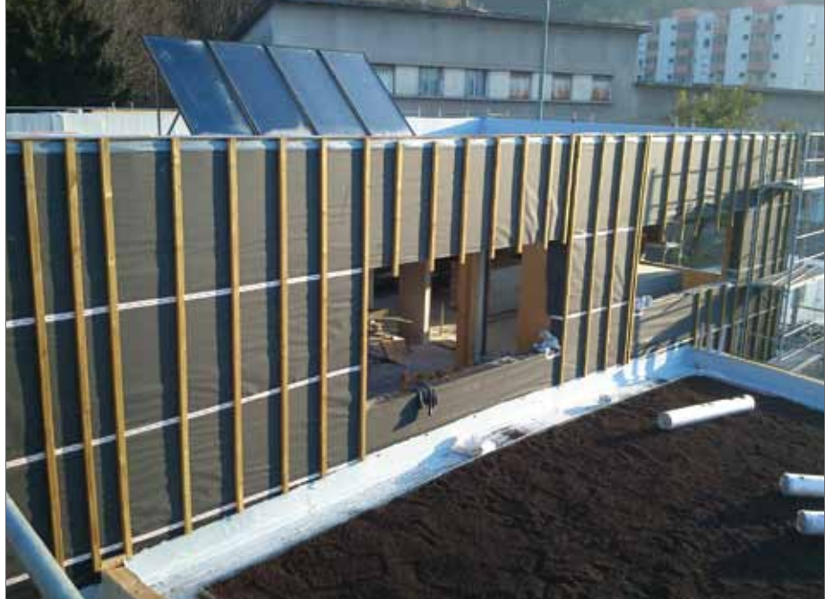
L'école maternelle est construite suivant les démarches BBC (ventilation double flux, panneaux solaires, toiture végétalisée...) et avec des produits écologiques, comme la ouate de cellulose, fabriquée d'environ 85 % de journaux recyclés et de 15 % de minerais.

Parmi les actions concrètes qui portent leurs fruits, on compte le traitement des plus gros consommateurs... les équipements publics ! Très anciens, pour la plupart vétustes et énergivores, ils ont été remplacés