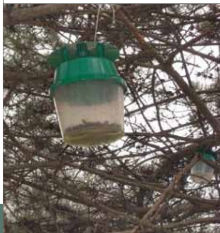
Des pièges naturels limitent le développement des chenilles processionnaires. En un an, le nombre de nids au parc Gontier est passé de 40 à 17 !

Les efforts ne se limitent pas aux bâtiments municipaux. Dans l'habitat individuel, on encourage des constructions écologiques et la densification des hameaux dans le respect de l'environnement, essentiellement sur le haut de la commune. Les élus ont autorisé une augmentation de 20 % de la surface constructible si la construction est en BBC (cf délibération du 28 juin 2010).